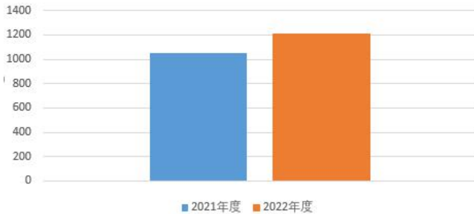
图1：收、支决算总计变动情况 (单位：万元)

2022年度收、支总计均为1212.35万元。与2021年度相比，收、支总计各增加164.45万元，增长15.69%，主要是财政监察任务增加。