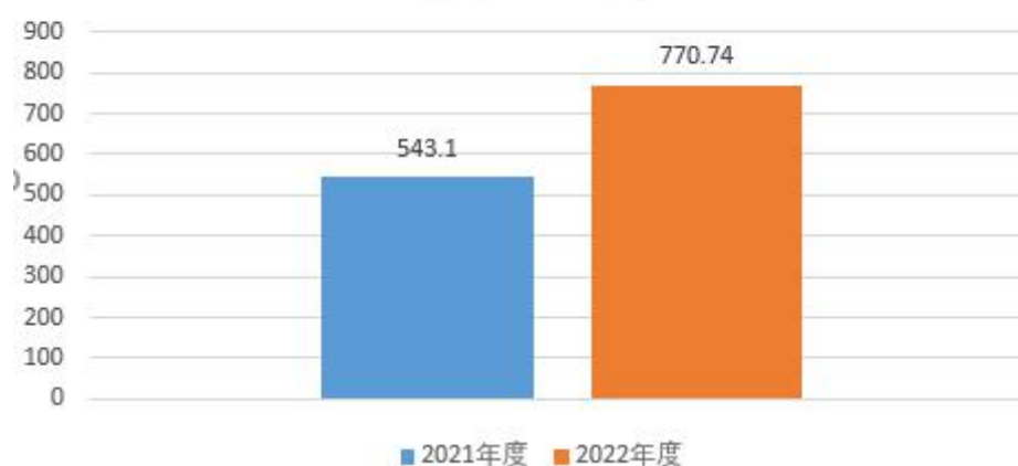
图5：财政拨款支出决算变动情况 (单位：万元)

2022年度财政拨款支出770.74万元，占本年支出合计的86.8%。与2021年度相比，财政拨款支出增加227.64万元，增长41.9%，主要是一般公共服务支出增加。